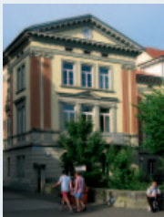
Evangelisches Pfarrhaus, Überlingen, Grabenstraße

Am Samstag bieten wir Ihnen Kinderbetreuung in lokalen Kindergärten an.